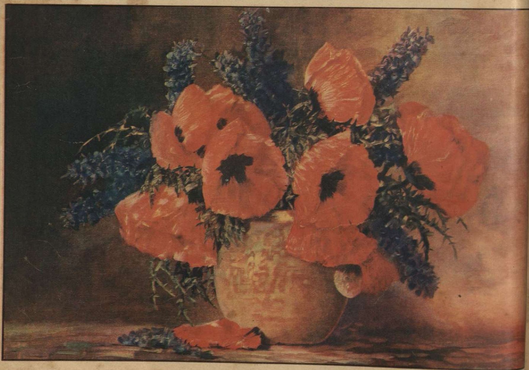
FLORES , por S. Streckenbach

El rostro de la amante resplandece con tan sincera emoción que el amor immortalizado por Shakespeare nos conmueve en la evocación del artista francés Bussiere, como algo vivido de muy cerca.