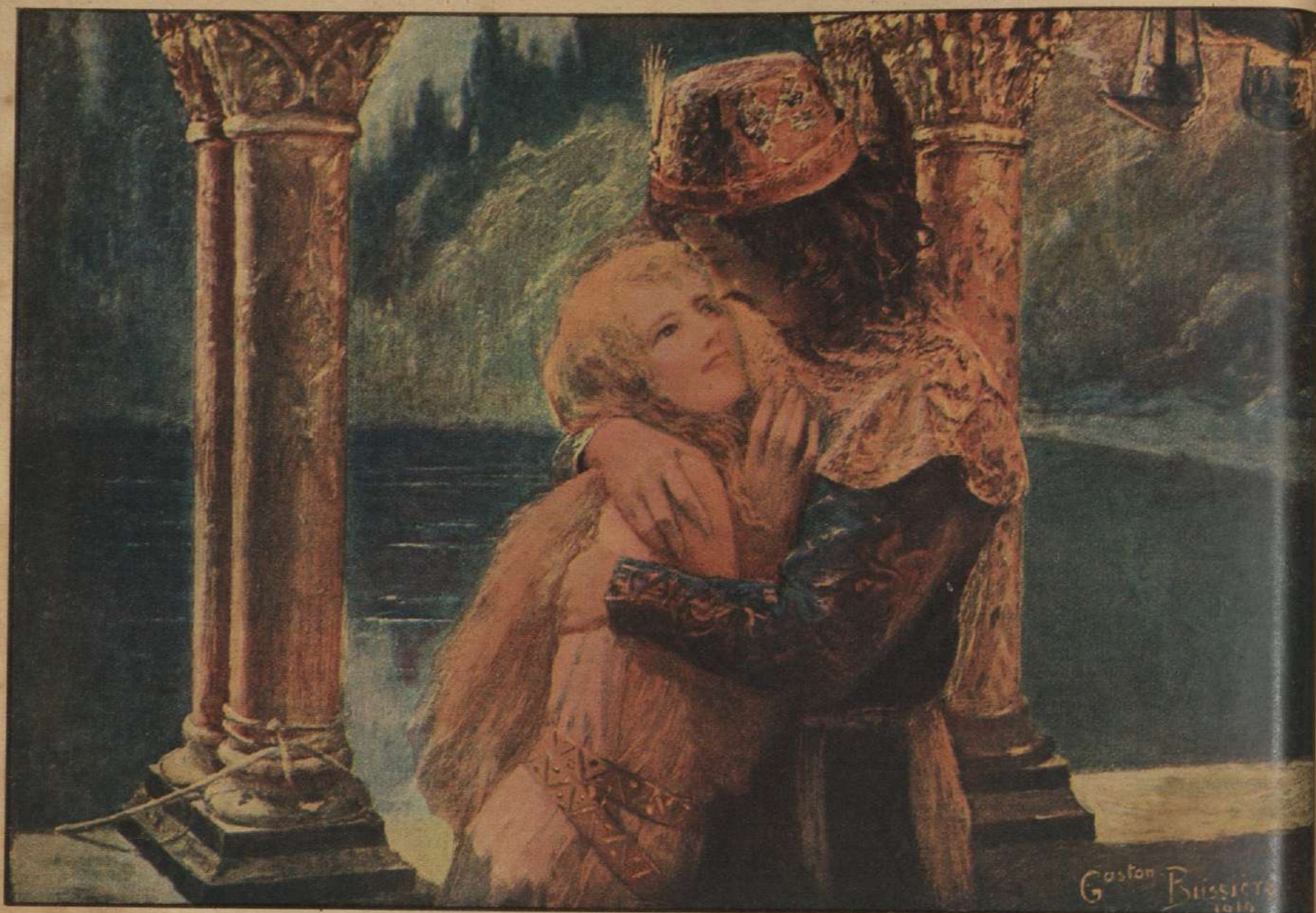
ROMEO Y JULIETA , por G. Bussiere

El rostro de la amante resplandece con tan sincera emoción que el amor immortalizado por Shakespeare nos conmueve en la evocación del artista francés Bussiere, como algo vivido de muy cerca.