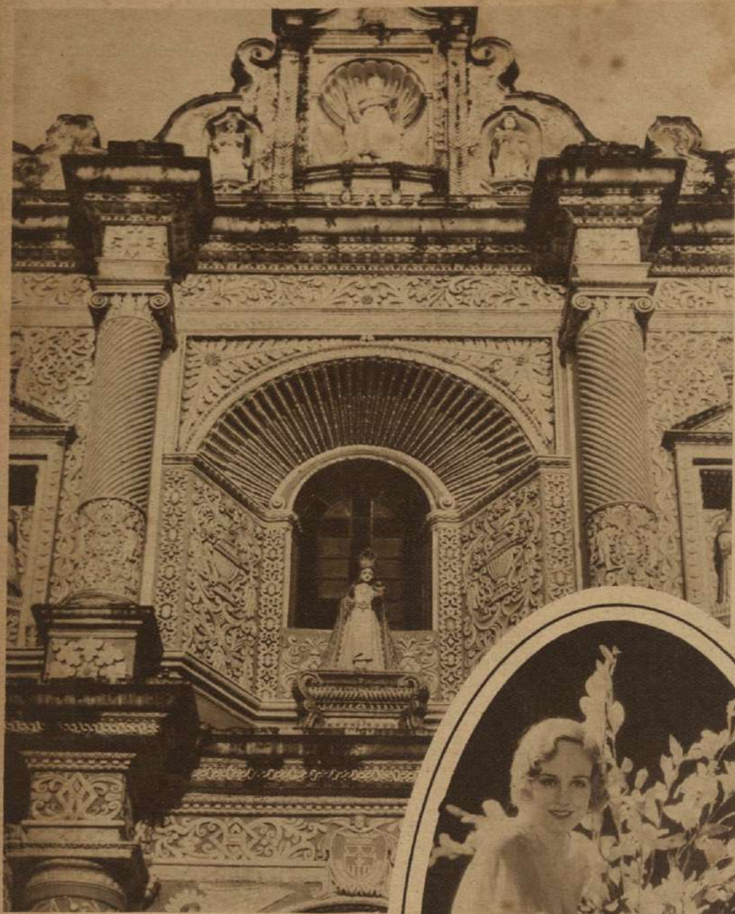
GUATEMALA.—Parte superior de la puerta de la Iglesia La Merced en la Antigua Guatemala. (Periodo colonial.)

(En el óvalo)—MADGE EVANS, la delicada actriz de la Metro-Goldwyn Meyer, anuncia el retorno del verano con un ramo de flores sobre el que luce su belleza.