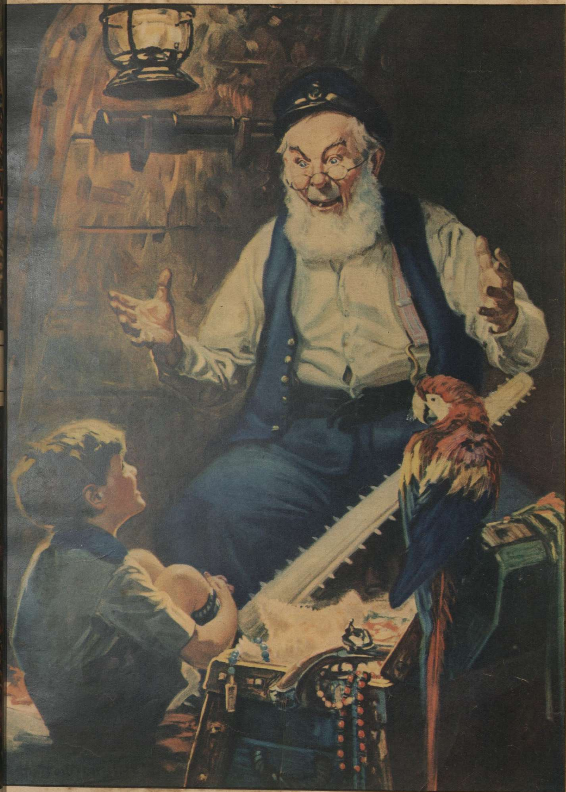
EL CUENTO INVEROSIMIL, por H. Hintermeister