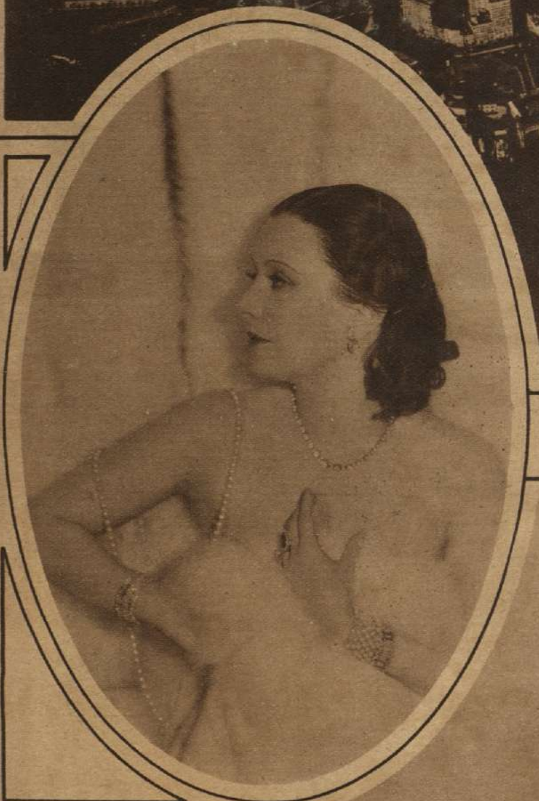
LA PAGANA GRACIA DE LIL DAGOVER , estrella de Warner Bros. tiene a la vez un modernismo exótico.