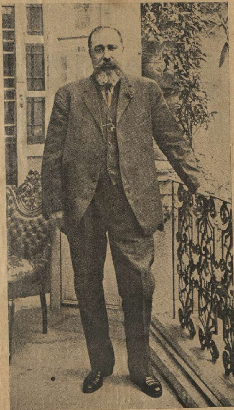
SEÑOR GENERAL LEONIDAS PLAZA GUTIERREZ, ex-Presidente de la República del Ecuador, que regresa al país, después de algunos años de ausencia.

La última llamada del timbre del EDEN. Se despiden de pri-