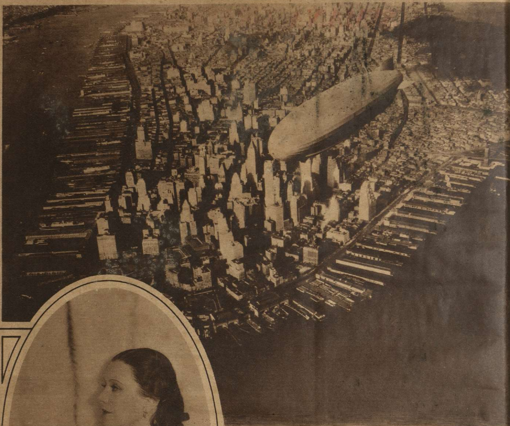
EL AKRON VISITA NUEVA YORK. —El dirigible más grande del mundo, volando sobre la parte inferior de la isla de Manhattan, donde los rascacielos presentan sus enormes pirámides de piedra y hierro.