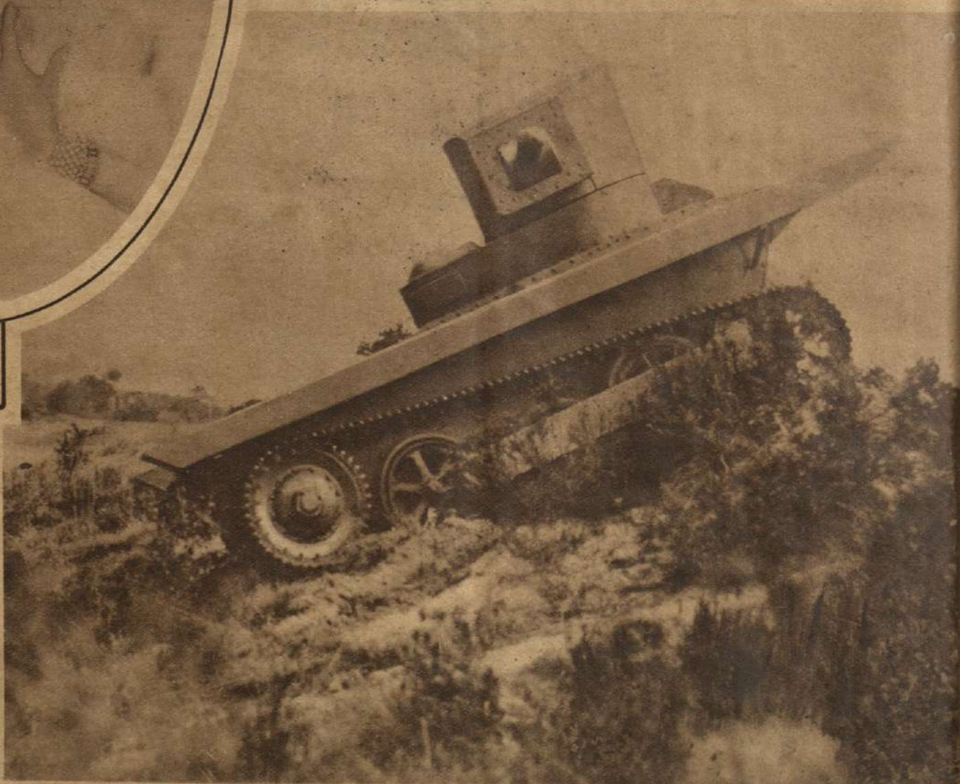
EXTRAÑO TANQUE ANFIBIO adoptado por el ejército británico, que se mueve a voluntad en agua y en tierra. Está armado con un cañón de 9 milímetros.