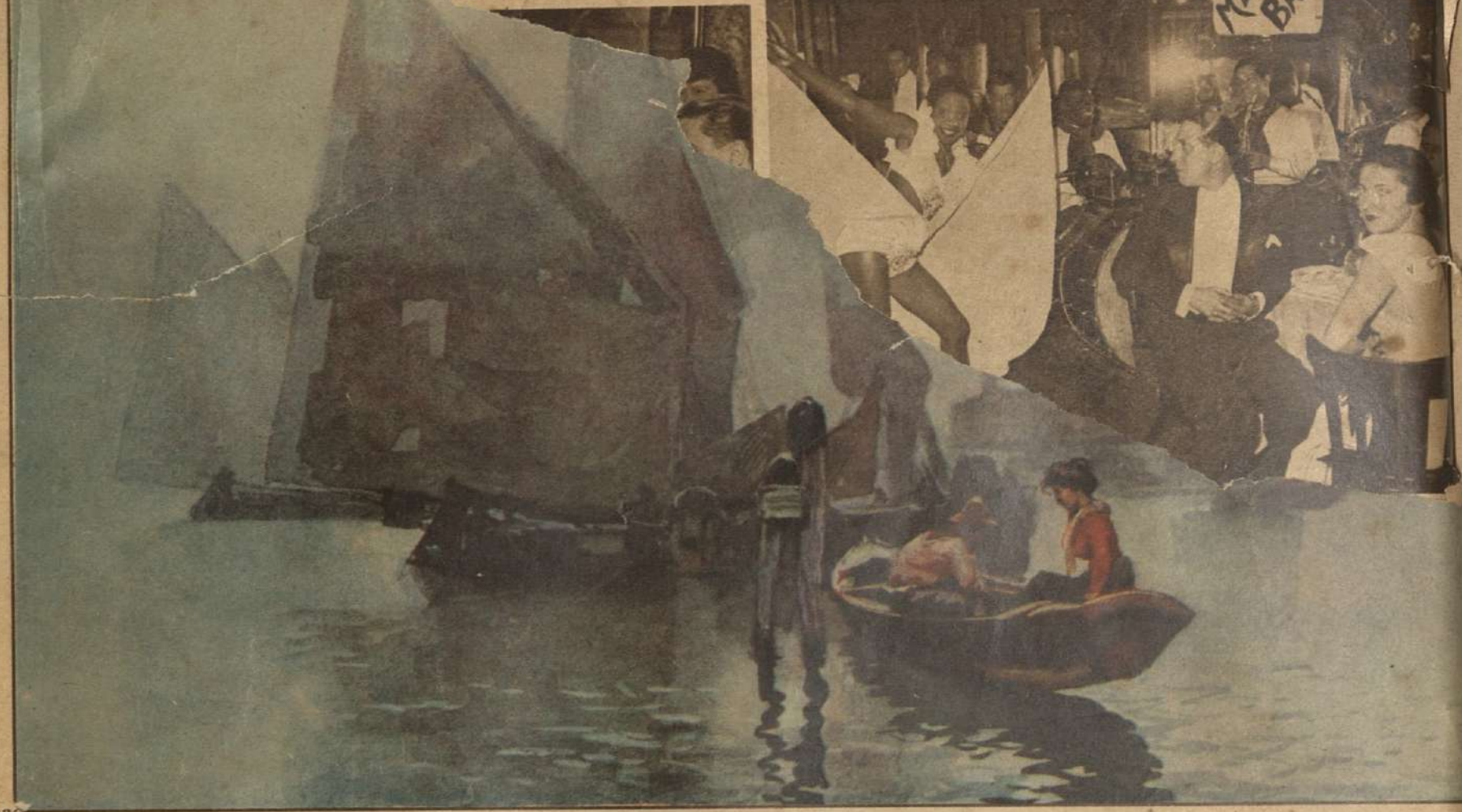
VISION DE VENEZIA.