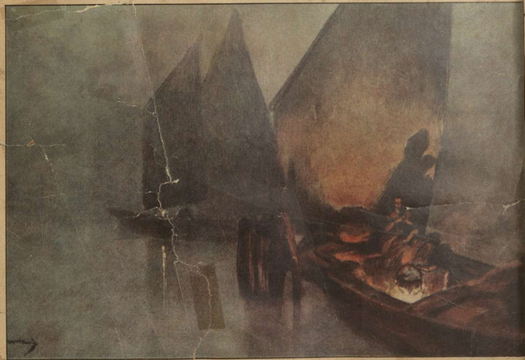
NOCHE EN LA LAGUNA