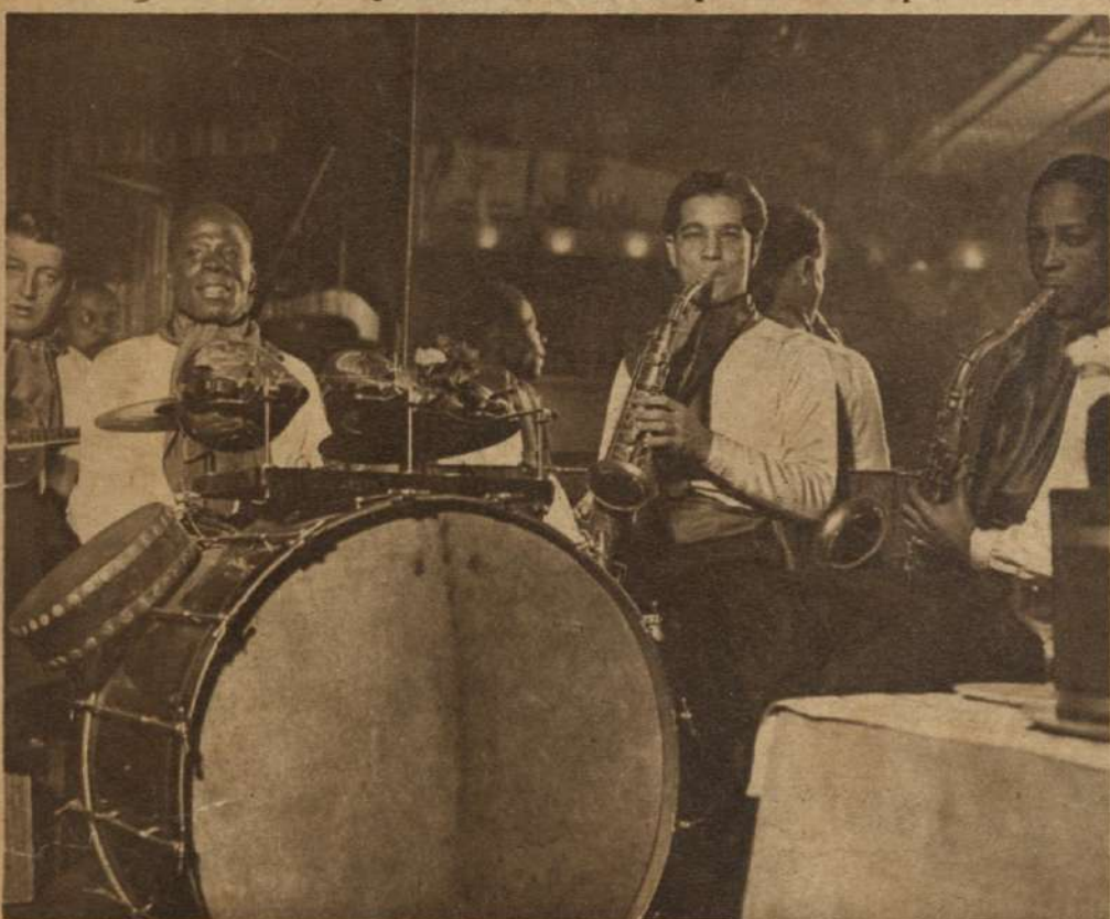
Las orquestas cubanas y argentinas gozan de gran popularidad.

La alegría nocturna de la Ciudad Luz ha tomado en los últimos años un tinte exótico en el cual se refleja la influencia norteamericana, estando de moda las orquestas y artistas impuestos por el gusto de los turistas. Asimismo, en vez de los vinos generosos, se consumen de preferencia licores fuertes y el "cocktail" ha adquirido carta de ciudadanía mundial, en vez de los inofensivos aperitivos continentales. He aquí una serie de fotografías imprevistas, logradas por un aficionado en un cabaret parisiense, frecuentado por el mundo que se divierte.