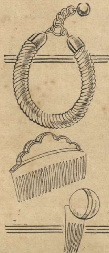
Arriba, un novegoso collar hecho de cáñamo retorcido, con terminaciones y cadena de oro en los extremos. — Abajo, dos modelos de peines de metal con una bola de metal y uno con piedras del Rhin. Se dice que tales peines están en gran demanda.