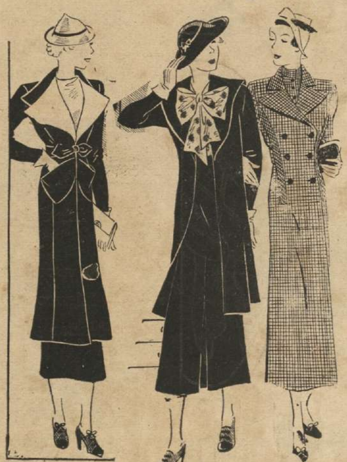
A la izquierda un precioso modelo de traje "Tailleur" en azul marino. El "nuevo tailleur fino" en el centro tiene un vestido de lana con tafeta estampada en la parte superior y un abrigo que llega a las rodillas. El modelo de la derecha es un "tailleur" de tela a cuadros.