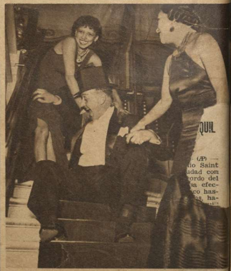
Un concurrente novato, no ha sabido mod