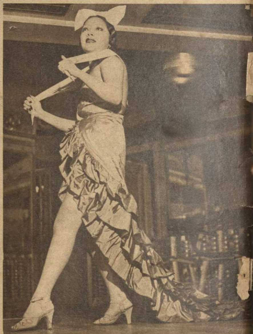
Una artista del tipo que entusiasma a los concurrentes a los cabarets.