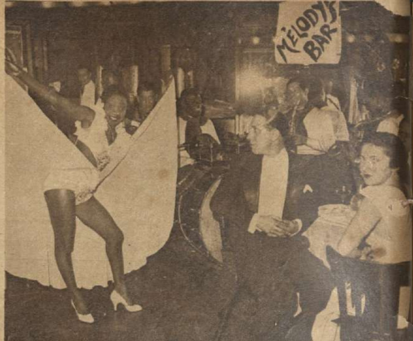
La orquesta redobla su cacofonía, a cuyo ruido se contorsiona una bailarina de color.