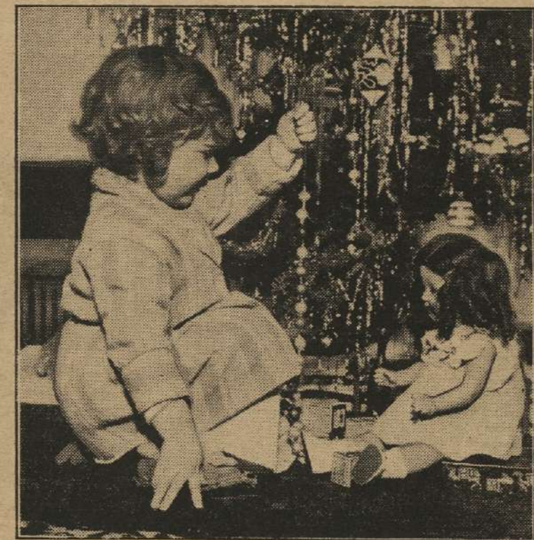
Cuando se prepara un álbum con fotos como esta, la alegría de la Navidad perdura.

MUCHOS aficionados resuelven por anticipado hacer un álbum con fotos tomadas durante las Navidades, Año Nuevo y Reyes pero sucede a menudo que el menos que canta un gallo entra la temporada y por falta de un buen programa nos quedamos con las ganas, o no lo hacemos bien.