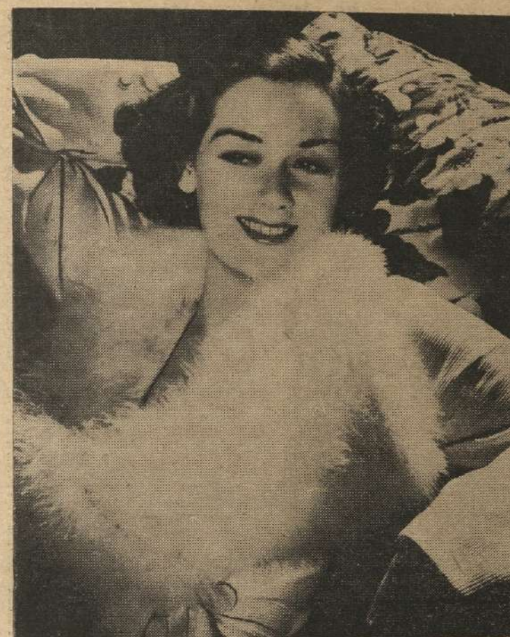
Rosalind Russell conviene con Max Factor en que un gran factor para la adquisición del "glamour" consiste en saber "tomar las cosas con calma".