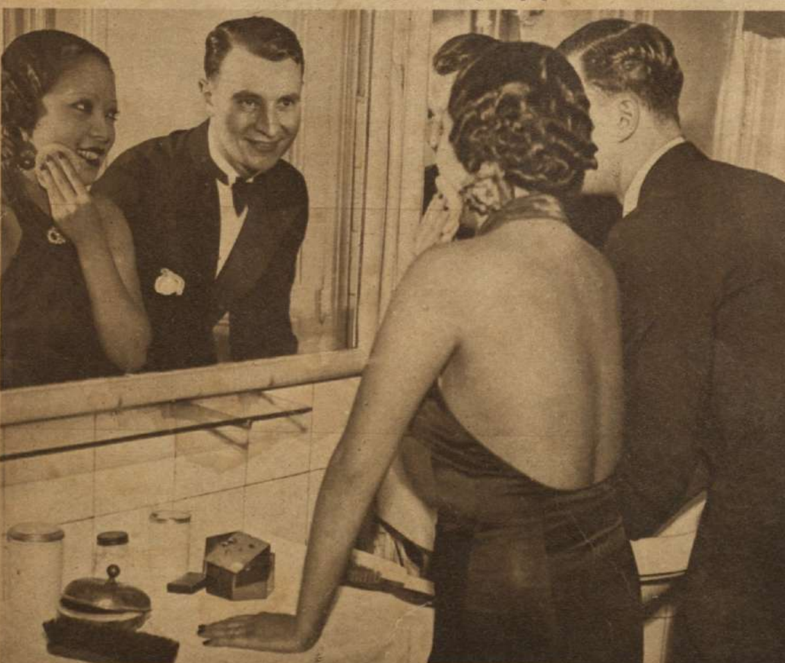
Reparando los destrozos del baile.